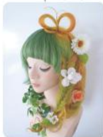
リロン賞「Spring garden」 西川 和実(平成25年度卒業生)