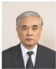
九州栄養福祉大学 東筑紫短期大学 学長

皆さん、今までやってきた受験勉強なんかとは少し違う専門分野で、「生活者」として一生生きていく上でこれだけは誰もが絶対やらなきゃいけないし、誰かがやらなきゃいけないという生活の基本中の基本、これを勉強するということなんです。簡単に分かりやすく言うと衣・食・住・子育て、介護・リハビリ、こういう地域社会で誰かがやってかきやいけなさい、家庭や社会で誰かがやんなきゃいけない、誰もがやんなきゃやるということなんです。それが皆さんの使命なので、私たちがここに人って来たわけなんです。学校の少子化とか景気不景気というところについてあんまり影響を受けてない方の学校です。基本中の基本を学ぶ学校ですから、誰かがやらなきゃなりませんから、衣食住とか子育てとか介護をやらなければ社会が崩壊しちゃいますからね、わかりますよね。皆さんの中には、数学とか私には不得意だし、英語とかも不得意だけでも、そういう人間が生きてく上で本当に必要な基本中の基本、実学の実学だつたらしてみたい、自分のためにも家族のためにも、社会のためにもやるんだと、そういう気概を持つて入ってきている人がたくさんいますね。いまどきこういう学問分野を選択する人というのは私は立派な人だと思つています。皆さん一人一人が、私は宝物だと思つています。ぜひそういう思いをね、完成してもらいたいと思うんです。ただ一つはじめに皆さんに言っておきます。よくね、本学に來ると高校時代の延長だ、とか言うんですよ。それはちよつと違います。高校時代の延長なんてもんじゃなし、高校以上にもつと凄いですから、それはね、何故かつていうと、本学のような生活実学の分野の勉強は最終的に国家資格と免許状を取らなければならぬからです。国家試験を通らなきゃいけないのです。勉強のやり方はなしてはだめですよ。国家試験で実績出さないと。さらにね、保育士とか幼稚園の先生とかは、同じ国家資格、教員