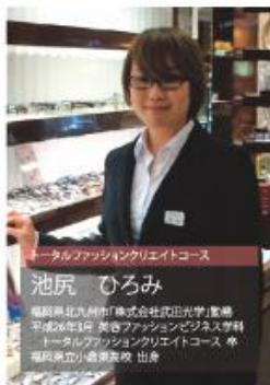
トータルファッションクリエイトコース

私は、トータルファッションクリエイトコース卒の充実した二年間を経て、学んだ内容を活かせる仕事に就きたいと思ひ、接客(販売)で、ただ商品を売るのではなく常にお客様立場になって考え、提案・対応できる職種を希望してました。ファッションパレル販売に興味があり、中でも眼鏡や時計というアイテムに心がひかれました。それは、実用面だけでなくトータルコーディネートの際点からも重要なファッション要素だからです。念願が叶い、株式会社武田光学に就職することができました。 就職後約一ヶ月が経過し、現在の社内内容は、接客は勿論ですが、ご来店いただいたお客様が、眼鏡や補聴器という高価なアイテムを安心して購入いただくのに、少しでも快適な時間を過ごしていただけるよう、掃除や商品整理に特に気を配り、店内のイメージや雰囲気、商品のサンクスメッセージなどを磨き上げるよう心掛けています。 学生時代は、幅広いカリキュラムでの勉強とともに、ファッション販売能力検定、カラーコーディネーター検定、ドレスタイリスト検定、ブライダルプランナー検定や日商PC検定、文書作成など、様々な検定にチャレンジし、合格することができました。社会人として活動を始めたばかりですが、検定に合格できたという達成感や自信は、大きな財産であり、「毎日すべてが勉強」で、一日も平穩な気持ちに陥るよう頑張ることという気持ちもなっています。 東筑紫短期大学の二年間は、本当に楽しく有意義な時間だったと、感謝の気持ちでいっぱいです。