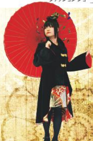
モデルズ5のオートモード