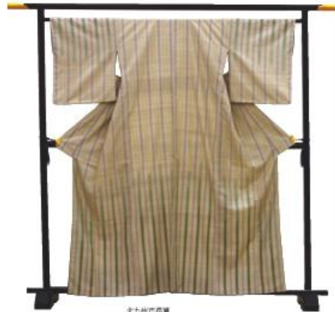
北九州市長賞 「染織」 豊島 沙織(平成25年度卒業生)