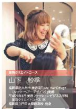
美容クリエイトコース