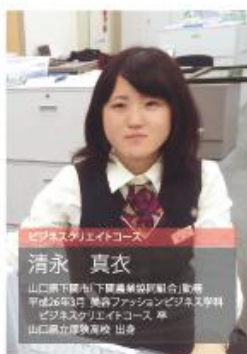
ビジネスクリエイトコース

短期大学での学生生活の二年間は、ほんとうにあつという間でした。しかし、この二年間で学べる時間はたくさんあると思います。 私の場合、学生生活の二年間で、資格取得に力を入れました。事務で使える資格などにも力を入れておりましたが、他にもアロマコーディネーターやブライダル関係、ファイナンシャルプランナーや医療実務士など、いろいろな分野で活用できる知識を身に付けることができました。そして、就職活動を行うときには、幅広く取り組むことができました。 東筑紫で学んだビジネススキルなどは、社会で来客対応の際にとっても役立つと思います。実学を目指し東筑紫の教育は必ず社会に出て役に立ちます。この二年間で少しでも多くのことを学んでほしいと思います。 私は在学生中は分からなかったけれど、卒業した時のこの学校で本当に良かったと思える有意義な楽しい二年間を過ごすことができました。 これから入学し、多くのことを学んでいける皆さん、東筑紫での二年間が一生の思い出になるように、一生懸命頑張ってください。