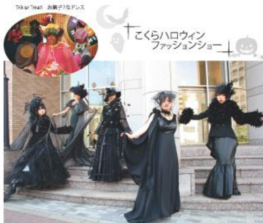
Fashion sabath おしゃれ麗女の夜会