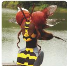
優秀賞「Honey-bee」 小倉 優