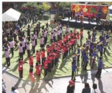
毎年恒例の九州栄養福祉大学・東筑筑短期大学大学祭は「劇〜今こそ集え筑紫の「皿」〜」をテーマに開催されました。