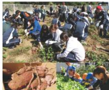
小倉南区キャンパス農園で行なわれ、木学1年生と附属幼稚園の年中さんが一緒に芋掘り、夏野菜の収穫、にんにくの苗植えを約300人で行いました。